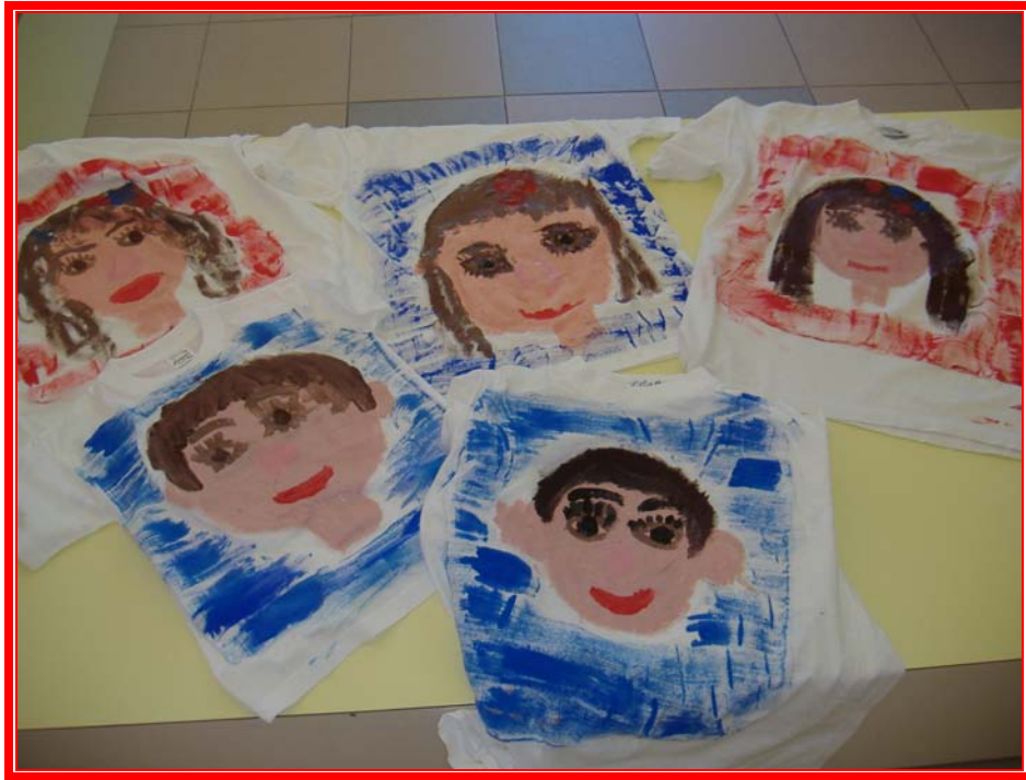
MAGLIETTA CON RITRATTO TECNICA: ACRILICI A PENNELLO